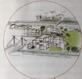
Un des deux villages d'habitations vu du Trapèze

Notre projet, ce sera 100 000 mètres carrés de constructions , alors que le PLU en prévoit 175 000 et que le maire sortant voulait qu'il y en ait 330 000 avec des tours de bureaux. Dans notre île, ce sera zéro bureau et zéro voiture .